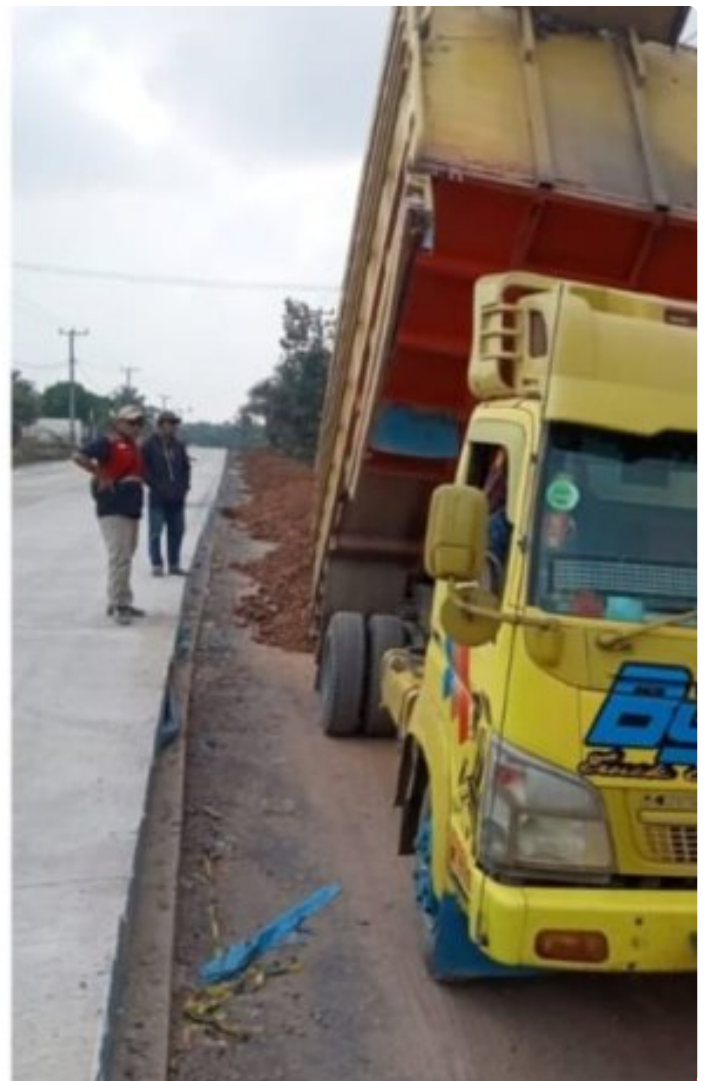
Mobil Pengangkut Tanah Galian C